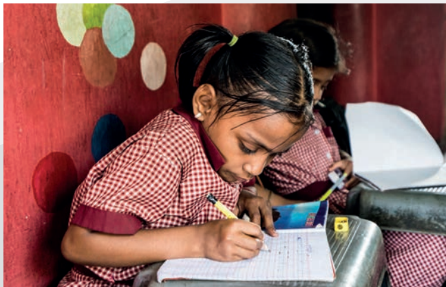
Kinder in einer Bildungseinrichtung von Calcutta Rescue

Calcutta Rescue Deutschland e.V. (CRD) wurde 1989 gegründet. Ziel des gemeinnützigen Vereins ist, die medizinische Versorgung und die Lebensumstände der Bedürftigen in Kolkata und Westbengalen zu verbessern sowie deren Bildung und Ausbildung zu fördern. Die rein ehrenamtliche Arbeit der über 100 Mitglieder in Deutschland ermöglicht, dass 100 % der Spenden nach Indien überwiesen werden können. Entstehende Druck- und Portokosten werden durch Mitgliedsbeiträge und zweckgebundene Spenden oder aus eigener Tasche bezahlt. Ein Großteil unserer Mitglieder war schon selbst in Kolkata und hat die Arbeit der Organisation vor Ort unterstützt.