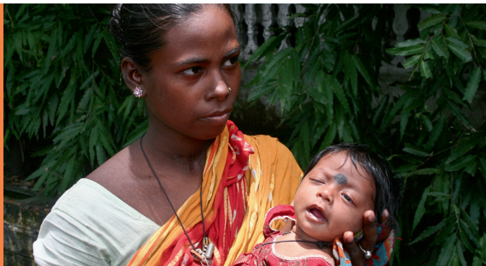
Eine junge Mutter mit Kind, die am Betreuungs-Programm teilnimmt

Gesundheitsversorgung – CR betreibt heute fünf Ambulanzen, in denen indische Ärzte und Helfer Diagnostik, Medikamente und Lebensmittel bereitstellen. Neben der medizinischen Grundversorgung liegt der Fokus auf Schwerpunkten wie Mutter/Kind, Tuberkulose, Lepra und Gesundheitserziehung. Die Hilfe gilt ausschließlich denen, die sich keine medizinische Behandlung leisten können (Einkommen < Existenzminimum von 0,90 €/Tag). Eine mobile Ambulanz trägt medizinische Grundversorgung und Gesundheitserziehung in die Slums von Kalkutta.