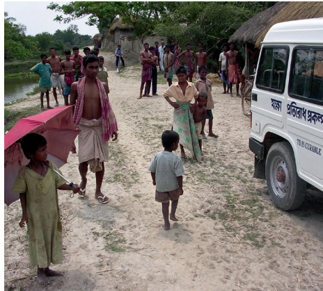
Der Jeep von CR bei der TB-Versorgung in den Außenbezirken Kalkuttas